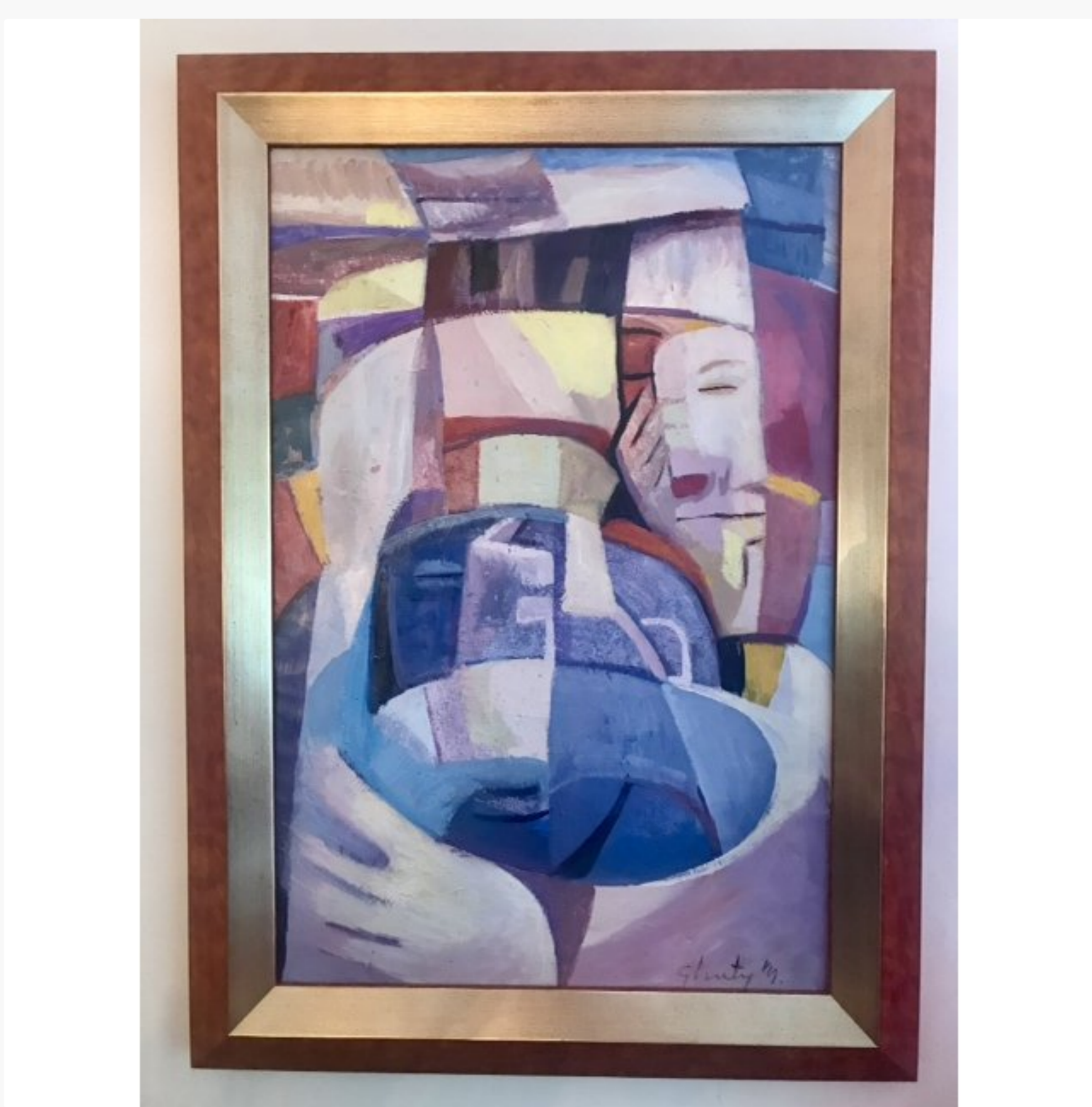
(kunst uit de collectie van Jur Botter)

In mijn werkkamer hangt een prachtig schilderij van de Grote Markt rond 1700. Ik zou het enorm spannend vinden als ik daar in die tijd een dag rond zou kunnen lopen. Ook heel bijzonder vind ik de Gravenzaal in het gemeentehuis, een plek waar al honderden jaren wordt vergaderd. Ik vraag me weleens af wie ben ik dat ik daar mag werken. Voor iemand die op de mavo is begonnen, is het toch mooi om dit mee te mogen maken.”