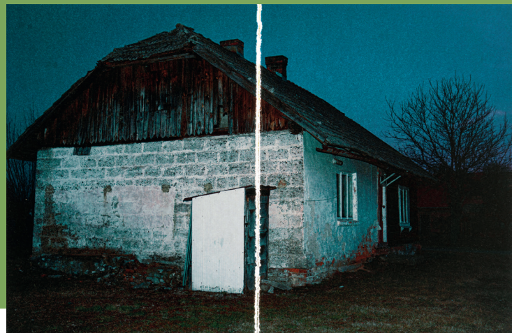
Sabina Van Gils: Waarom paarden niet meer praten