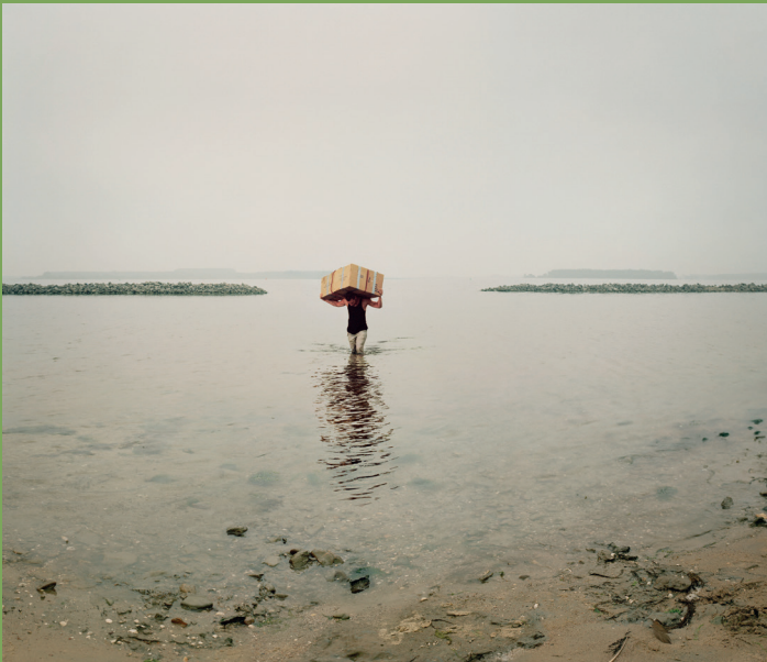
Ellen Kooi: Veere Atlas