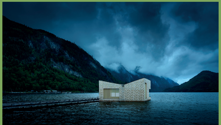
Michel Campfens: Noorwegen

Ook te zien in Anno Haarlem, Grote Markt 2