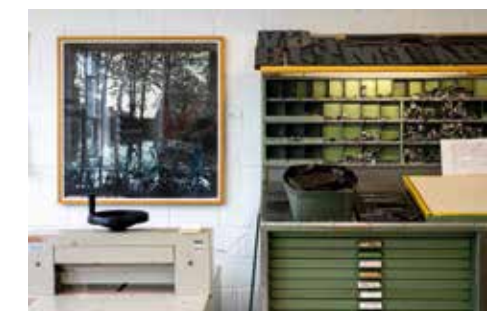
Tekst Meta van der Meijden.

wat er allemaal bij komt kijken om van een stukje linoleum een afdruk te maken. "Naar aanleiding van een dierenplaatje uit een van onze boeken of een selfie op hun telefoon, gaan ze tekenen, overtrekken en vervolgens snijden. De meeste kinderen hebben nog nooit een linoleumsnede gemaakt. In een paar uur creëren ze iets waarvan ze niet hadden gedacht dat ze dat zouden kunnen. De magie van de afdruk, ze zien ineens wat al die inspanning oplevert. Ze hebben echt de meest fantastische dingen gemaakt. Gelukkig zijn de kinderen zelf ook erg enthousiast over het resultaat en dat maakt mij weer blij. *